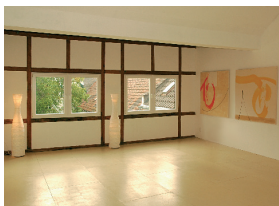
Seminarraum 60qm mit Blick auf den grünen Innenhof

Der große ruhige Seminarraum Pfau befindet sich unterm Dach des Seitenflügels. Seit der Renovierung sind das alte Fachwerk und die alten Holzbalken freigelegt. Es ist ein freundlicher, offener Raum mit klarer Ausstrahlung.