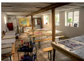
Malstudio 51 qm

Im kleinen Seminarraum Rheinblick mit 35m 2 im ersten Stock des Haupthauses mit Blick auf den Fluss fällt sehr viel Licht durch die historischen Vorhänge. Das geölte Parkett sorgt für eine gemütlich-warme Atmosphäre.