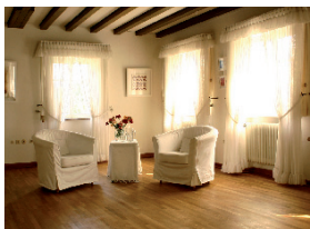
Seminarraum 35qm mit Rheinblick

Der helle und freundliche Seminarraum zum Hof mit hohen Decken befindet sich gegenüber des Haupthauses. Er hat einen fast quadratischen Grundriss und eignet sich sehr gut für Tanz- und Bewegungsworkshops u.ä.