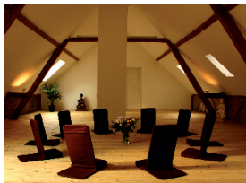
Seminarraum Pfau 75qm im Fachwerkboden

Der große ruhige Seminarraum Pfau befindet sich unterm Dach des Seitenflügels. Seit der Renovierung sind das alte Fachwerk und die alten Holzbalken freigelegt. Es ist ein freundlicher, offener Raum mit klarer Ausstrahlung.